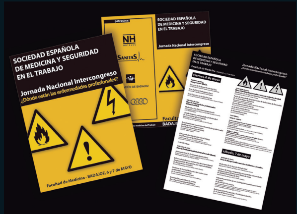
Cliente: Colegio de Médicos de Badajoz