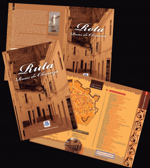
Cliente: Excmo. Ayuntamiento de Olivenza