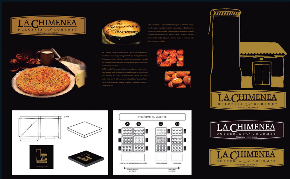
Cliente: La Chimenea - Dulcería Gourmet