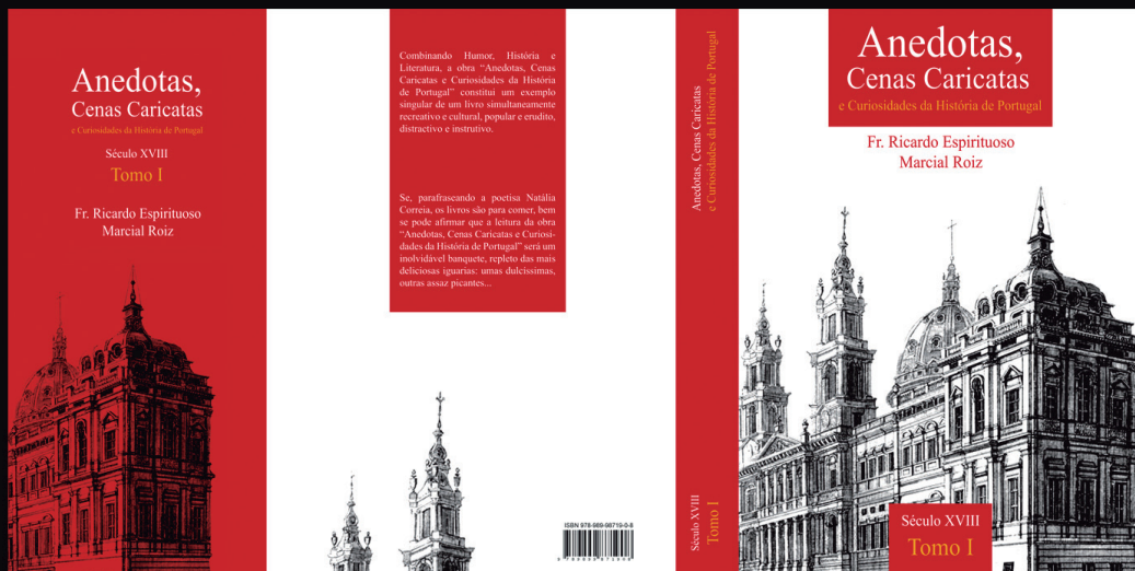
Cliente: Editora Leiria