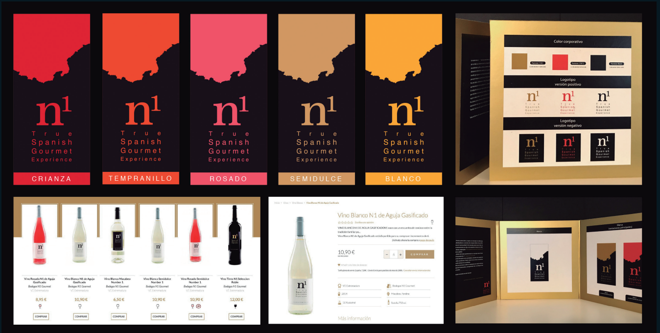
Cliente: Bodegas N1