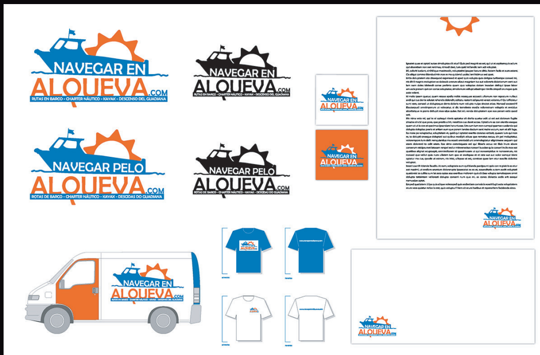
Cliente: Navegar en Alqueva