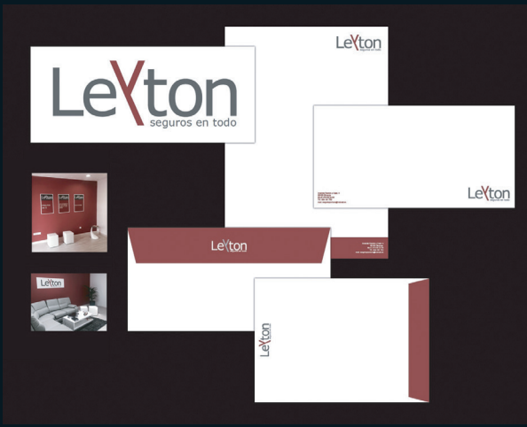
Cliente: Leyton Seguros