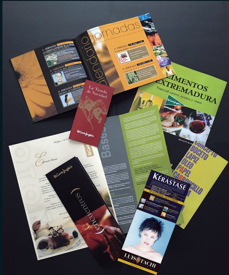
Cliente: El Corte Inglés