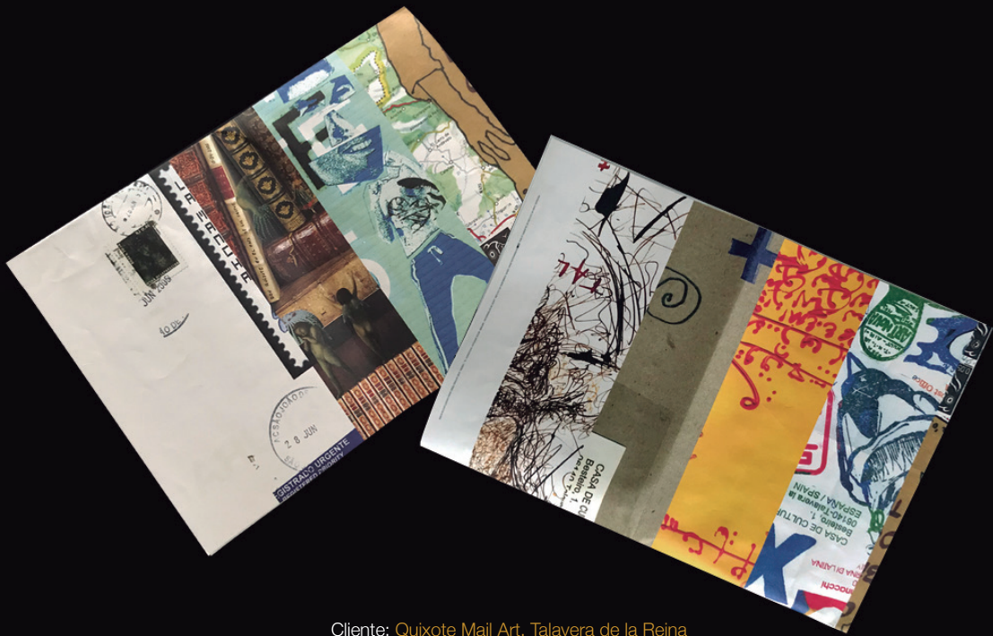
Cliente: Quixote Mail Art. Talavera de la Reina