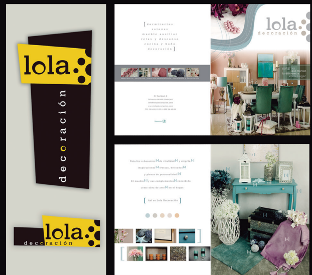
Cliente: Lola decoración