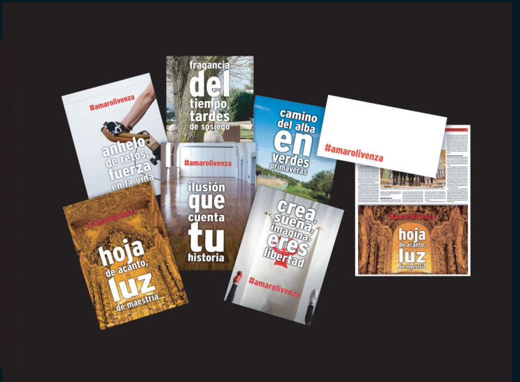
Cliente: Campaña PSOE Olivenza