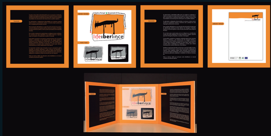
Cliente: Life Iberlince. Junta de Andalucía