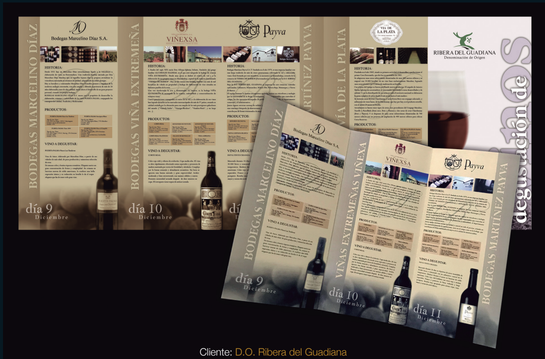
Cliente: D.O. Ribera del Guadiana